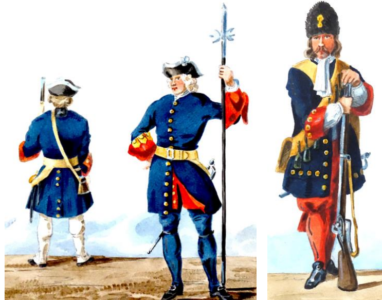
Soldats des compagnies franches de la marine vers 1748 (dessin de Valmont)