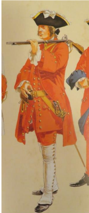
Garde de l'étendard des galères de 1741 à 1748 (dessin de Pétard)

Dès lors, il n'y eut plus de grades particuliers de galère, mais uniquement des grades de vaisseau : les chefs d'escadre des galères devinrent chefs d'escadre des armées navales, jusqu'aux enseignes des galères qui furent transformés en enseigne de vaisseau. De même, les gardes de l'étendard furent incorporés dans la compagnie des gardes du pavillon. Mais de nombreux officiers anciens des galères ne poursuivirent pas leur carrière navale.