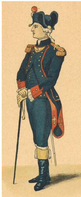
Capitaine des canoniers-matelots. (Dessin de Rouillet)

Pour les garnisons de ses vaisseaux, la Marine disposait depuis l'ordonnance du 26 décembre 1774 du corps royal d'infanterie de marine, soit 11 800 soldats aptes au service de l'infanterie comme de l'artillerie. Ce corps avait pris le nom de corps royal de la Marine le 4 février 1782 34 . La Marine était donc indépendante de l'Armée pour ses moyens.