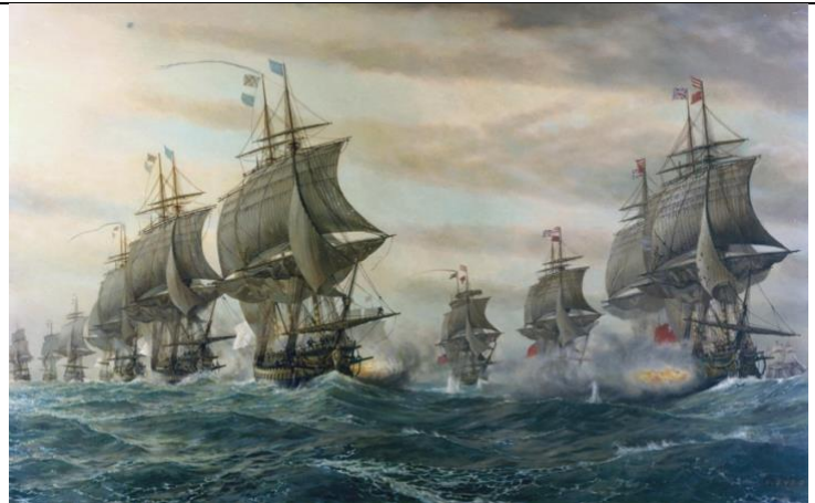
La Bataille de la Chesapeake, le 5 septembre 1781.

L'année suivante est celle de la célèbre victoire de la baie de la Chesapeake (5 septembre), remportée par le lieutenant général François Joseph Paul, marquis de Grasse Tilly, comte de Grasse, intervenant au secours de Washington, contre l'escadre du vice-amiral Samuel Graves.