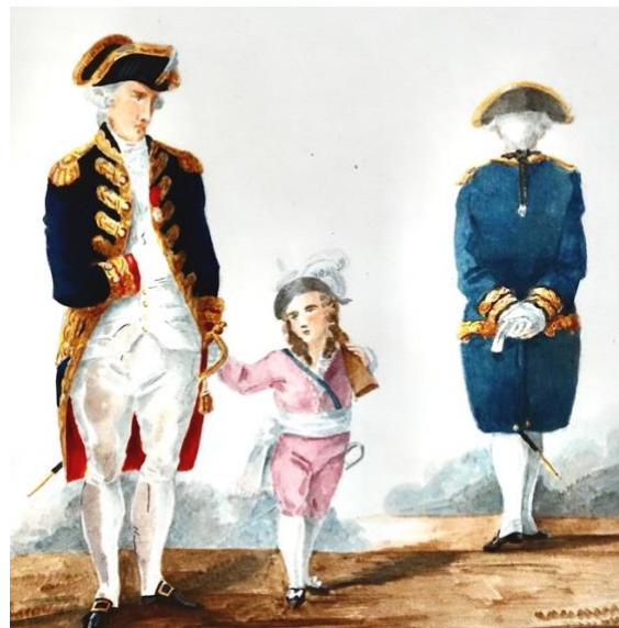
Capitaine de port et ingénieur-sous-directeur de dos en grand uniforme de 1786. (Dessins de Valmont)