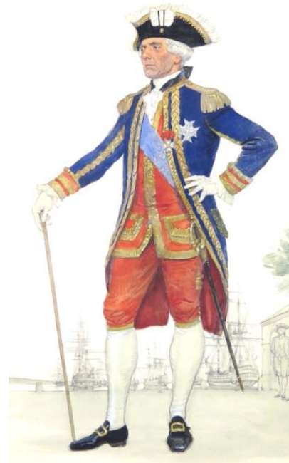
Vice-amiral en grand uniforme de 1786. (Dessin de Ledoux)

Seuls les officiers de vaisseau étaient considérés comme officiers de la Marine, c'est-à-dire officiers militaires. Tous les autres corps d'officiers étaient considérés comme des agents civils : intendants, commissaires et commissaires des classes (commissaires généraux, commissaires ordinaires), gardes-magasins, contrôleurs, ingénieurs-constructeurs (ingénieurs-directeurs, ingénieurs-sous-directeur, ingénieurs ordinaires et sous-ingénieurs), médecins (premiers médecins, deuxièmes, troisièmes) et chirurgiens (chirurgiens majors et seconds chirurgiens).