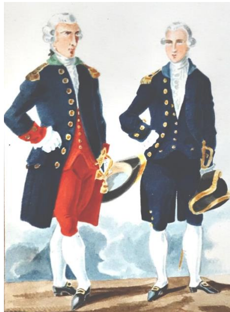
Lieutenant de vaisseau de la 3 e escadre et élève de marine de la 5 e escadre en grand uniforme de 1786. (Dessin de Valmont)