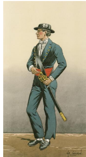
Matelot en 1786 (une représentation toute personnelle). (Dessin de Goichon)