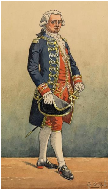
Capitaine de vaisseau de la 5 e escadre en grand uniforme de 1786. (Dessin de Goichon)