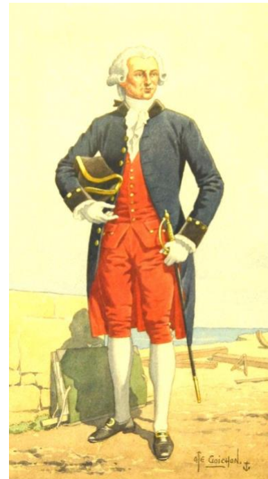
Ingénieur-constructeur (Dessin de Goichon)

Les ingénieurs-constructeurs sont l'objet de la dixième ordonnance 28 . Celle-ci traite de leurs grades (ingénieur-directeur, ingénieur-sous-directeur, ingénieur ordinaire, sous-ingénieur), leurs fonctions qui étaient peu différentes de celles posées par l'ordonnance du 27 septembre 1776, leur assimilation aux officiers de vaisseau et leurs affectations : ils étaient répartis entre les 3 grands ports et celui de Lorient ; certains étaient détachés dans les provinces pour visiter les forêts et choisir les bois de construction ; d'autres jeunes ingénieurs étaient embarqués sur les vaisseaux pour bien comprendre les besoins de ceux-ci. Les ingénieurs-constructeurs se distinguaient des officiers de vaisseau par leurs parements et collet en velours noir.