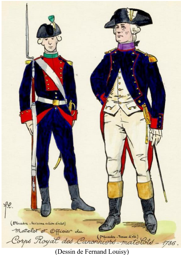
(Dessin de Fernand Louisy)

l'Armée pour les garnisons de ses vaisseaux... 81 compagnies de canonniers-matelots (effectif du temps de paix de 97 hommes, réduit à 67 le 25 janvier 1789) seraient regroupées en 9 divisions, chacune des divisions étant attachée à une escadre. Mi-soldats, mi-marins, professionnels de l'artillerie, les canonniers matelots seraient complétés par 10 matelots des classes par compagnie qui seraient spécialement instruits.