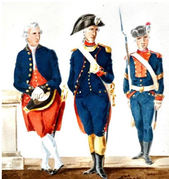
Ingénieur-constructeur et officier et sous-officier des canonniers-matelots en 1786. (Dessin de Valmont)

Dans cette description ne figurent pas les gradés canonniers, puisqu'ils faisaient partie des canonniers-matelots qui disposaient d'un uniforme spécifique. On peut même affirmer que les matelots de ce corps furent des précurseurs en la matière puisqu'ils furent les tous premiers matelots disposant d'un uniforme.