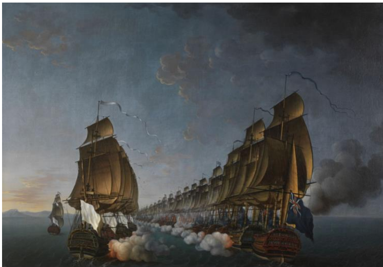
Combat de Gondelour le 20 juin 1783 (de Rossel Auguste Louis – Musée national de la Marine)