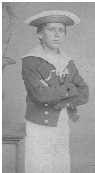
Matelot des équipages de la flotte à la fin du Second Empire. Inscrit maritime, recruté (appelé) ou engagé ? Aucun signe extérieur ne permet de le distinguer

Dans ce système, la Marine recevait la portion congrue. A titre d'exemple, sur le contingent de 80 000 hommes de la classe 1836, elle n'en reçut que 4 100 dont 1 800 pour ses équipages de ligne, les autres étant destinés à l'infanterie et à l'artillerie de la Marine 6 .