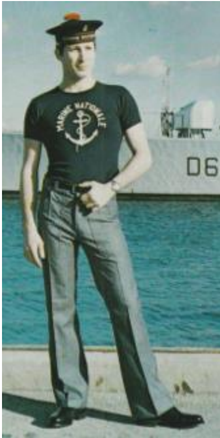
Matelot en 1978 (publication officielle « Uniformes et tenues des personnels militaires de l'armée de mer »)

matelots de la spécialité équipage. A partir de juillet 1983, il fut possible à certains appelés volontaires de servir plus que les 12 mois légaux en contractant une prolongation de 4 à 12 mois (« volontaires service long », VSL), ce qui améliorait leur employabilité dans les postes techniques.