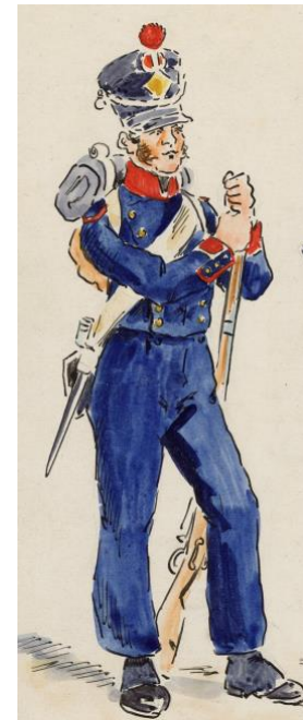
Matelot de la marine impériale entre 1808 et 1811 (dessin de Boisselier, d'après Valmont)

Le prélèvement de conscrits au profit de la marine commença en 1803 2 avec 2 000 ouvriers nécessaires à la construction navale venant de tous les départements, y compris de l'intérieur des terres. Pour les marins embarqués, il ne commença vraiment qu'en 1808 3 pour s'amplifier à partir de 1811 4 . Les marins prélevés dans les classes des départements maritimes cherchaient naturellement à se soustraire à leurs obligations, d'autant plus qu'un doute subsistait quant aux conséquences de l'inscription maritime sur la conscription, systèmes jugés par certains comme incompatibles. En mal d'effectifs pour la Grande Armée, l'Empereur dut lui-même rappeler qu'un inscrit ne servant pas actuellement dans la Marine ne pouvait arguer de son possible rappel ultérieur dans ce cadre pour échapper aux obligations militaires de la conscription dans l'Armée 5 . Ceci contrevenait aux dispositions qui avaient été rappelées par la circulaire du ministre de la Marine du 15 décembre 1806 qui, à l'époque, voulait préserver les inscrits, ou ceux réunissant les conditions pour le devenir, de l'appel à servir dans l'Armée. Pour autant, l'Empereur avait déjà extrait des professions éligibles à l'inscription les cordiers, tonneliers et poulieurs en fructidor an XII (août – septembre 1804) et les scieurs de long le 1 er janvier 1807, jugeant qu'il était trop facile de se réclamer de ces professions pour échapper à la conscription au profit de la Grande Armée.