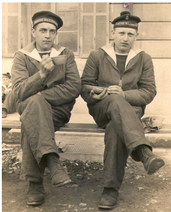
Matelots d'un dépôt dans les années 1930

On imagine aisément que les 28 années d'obligations militaires potentielles n'étaient pas en accord avec les réels besoins de la Marine. Celle-ci clarifia la situation en faisant voter la loi du 13 décembre 1932 qui posa que les réservistes de l'armée de mer en excédent étaient versés aux réserves de l'Armée, comme cela s'était déjà fait. Mais l'objet de cette loi était également de régler le service des cadres embarqués sur les navires de commerce réquisitionnés en temps de guerre.