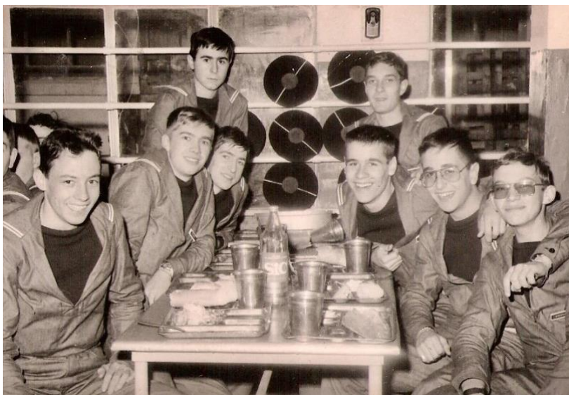
Des matelots appelés au centre de formation marine d'Hourtin en 1972-73

En 1980, il y avait encore 18 000 appelés dans la Marine nationale, employés à terre et dans des postes embarqués. Les appelés recevaient une formation avant de rallier leurs unités. Ainsi, à partir de 1950, les jeunes marins du contingent furent instruits au Centre de formation marine d'Hourtin, puis également à celui de Querqueville à partir de 1975.