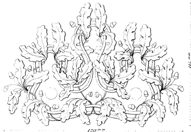
Collet, parement et écusson de l'habit de grande tenue 1853 de trésorier général