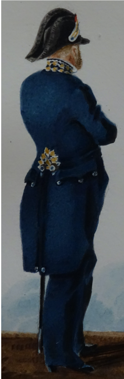
Valmont est semble-t-il le seul à avoir représenté ces agents particuliers. Il fixe l'année de la création d'un uniforme pour les trésoriers des Invalides à 1830, mais aucun texte officiel ne l'évoque (confusion avec les commissaires rapporteurs et greffiers des tribunaux maritimes ?)...