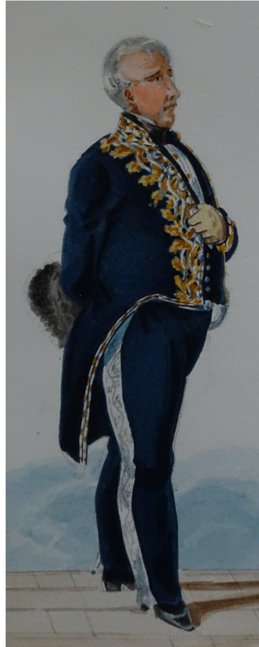
Le seul texte définissant l'uniforme des trésoriers date de 1853. Valmont est donc tout à fait légitime à nous présenter ici le trésorier général des Invalides. Celui-ci porte un pantalon à large bande argent et un habit richement brodé d'or et d'argent sur la poitrine, le bord des basques, le collet, les parements et la taille (écusson dans le dos). Le chapeau monté est bordé d'un galon noir et porte la plume noire frisée des hauts-fonctionnaires.