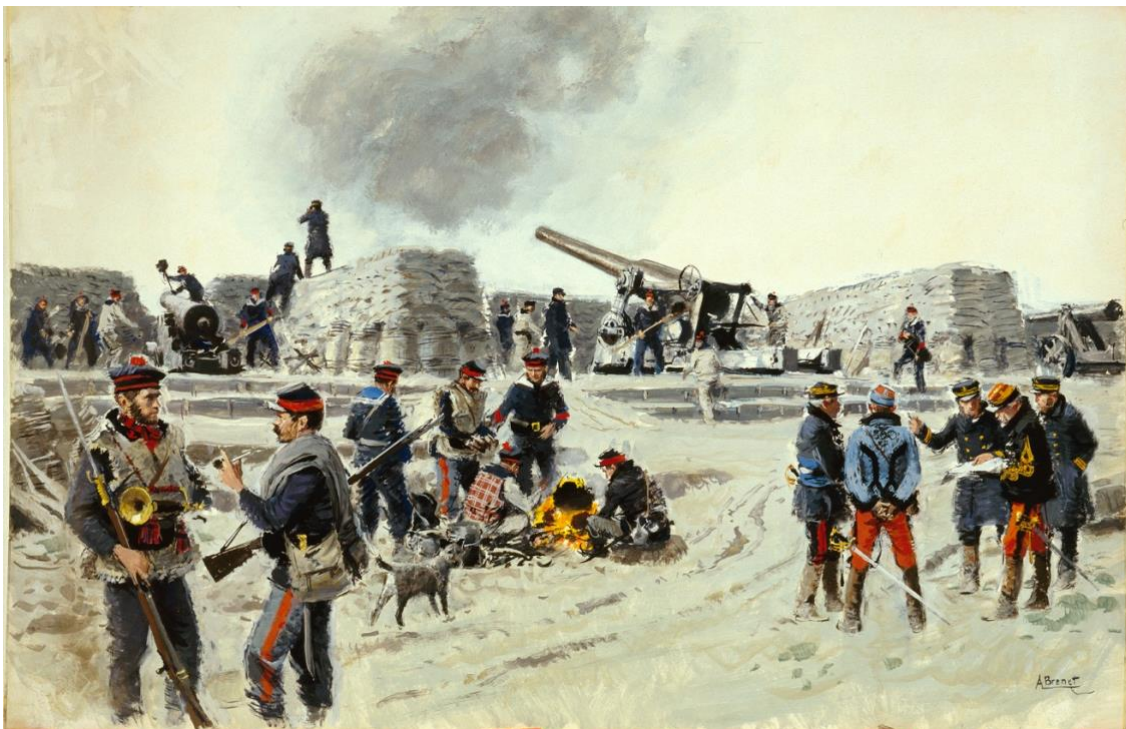
Les marins au siège de Paris en 1871, armant le canon la Joséphine (tableau de Brenet)

Le vice-amiral Clément de La Roncière Le Noury fut envoyé à Paris avant l'investissement complet de la capitale pour être placé à la tête des 500 hommes de la flottille de la Seine, commandée par le capitaine de vaisseau Thomasset , et des près de 8 500 hommes de la division des marins détachés, venant de Cherbourg, Brest, Lorient, Rochefort et Toulon.