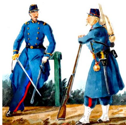
Infanterie de marine en 1870-71 (dessin de Valmont)

Voilà des propos blessants et une impression générale que nous avons voulu atténuer, car les marins n'ont pas compté leurs efforts à la mer. D'abord en Baltique pour un projet d'expédition comprenant un débarquement sur les arrières de l'ennemi ; elle avait été mal préparée par les ministres de la Marine, l'amiral Rigault de Genouilly, et de la Guerre ; le projet dut être abandonné par son plus fervent promoteur, le vice-amiral Bouët-Willamez , après les revers de l'armée impériale en Alsace, remplacé par un coûteux et illusoire blocus des côtes allemandes, avec le secret espoir de rencontrer l'ennemi dans