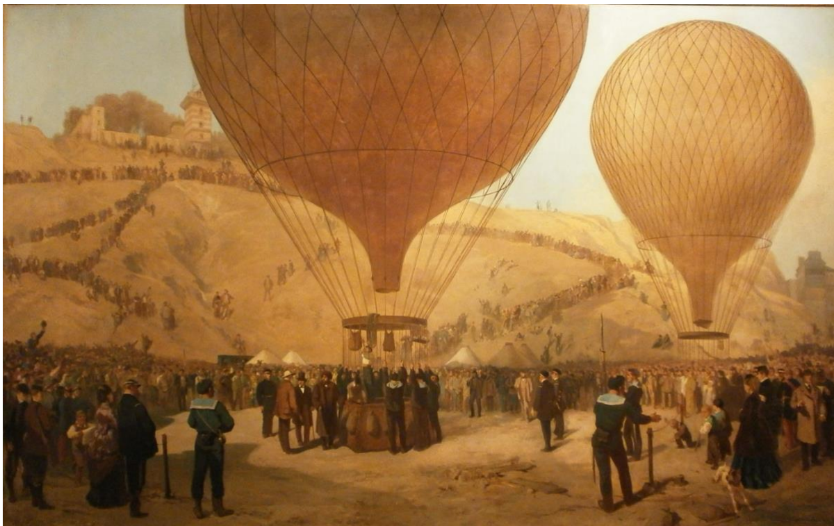
Départ de Gambetta en ballon (tableau de Guiaud et Didier)

Des tentatives de sortie destinées à assurer la liaison avec les armées de province eurent également lieu par les airs. Sur les 66 vols de ballon, 29 furent pilotés par des marins provenant de la division des marins détachés. Ces missions étaient particulièrement périlleuses ; plusieurs d'entre elles amenèrent leurs passagers dans des pays étrangers ; une seule entraîna leur perte au-dessus de la Manche. Le ballon dirigeable de l'ingénieur général du génie maritime en retraite Dupuy de Lôme arriverait trop tard.