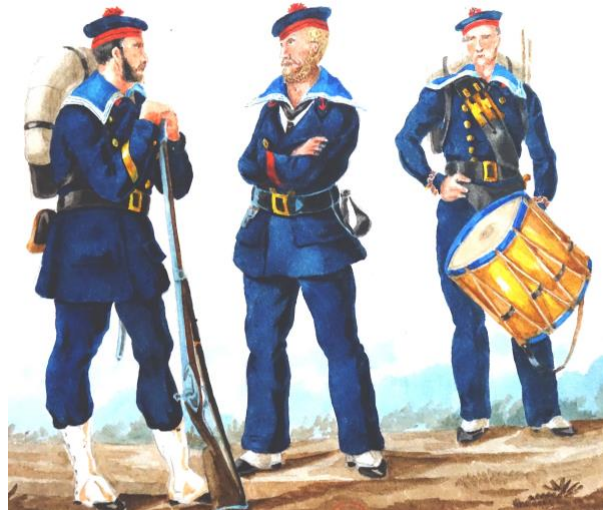
Second maître, matelot et tambour d'un bataillon de marins (dessin de Valmont)