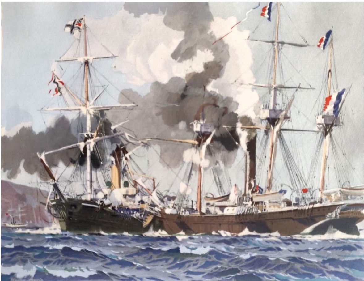
Le combat naval du Bouvet et du Meteor (aquarelle de Marin Marie)