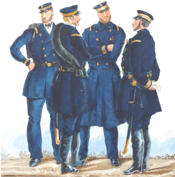
Des officiers d'un bataillon de marins (dessin de Valmont)

en Suisse de l'armée du général Bourbaki, transférée avant cette funeste fin au général Clinchant. Penhoat s'exfiltra vers le Sud pour se remettre à la disposition du Gouvernement replié à Bordeaux qu'il rallia au début de février 1871.