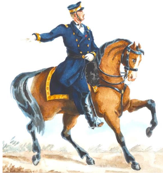
Capitaine de vaisseau, général auxiliaire aux armées de province (dessin de Valmont)

Le vice-amiral Clément de La Roncière Le Noury fut envoyé à Paris avant l'investissement complet de la capitale pour être placé à la tête des 500 hommes de la flottille de la Seine, commandée par le capitaine de vaisseau Thomasset , et des près de 8 500 hommes de la division des marins détachés, venant de Cherbourg, Brest, Lorient, Rochefort et Toulon.