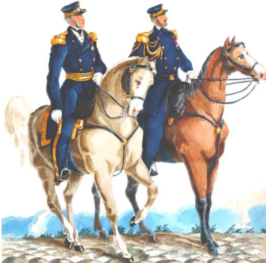
Un contre-amiral et son aide de camp pendant la campagne des armées de province (dessin de Valmont)