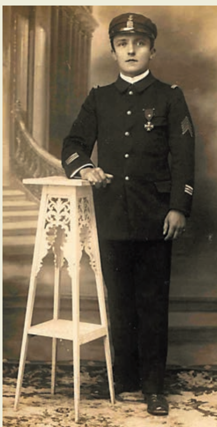
Lieutenant de vaisseau portant une casquette de mer et un veston avec des galons de taille réduite et chevrons de présence au front.

La même loi supprime temporairement le grade d'aspirant de marine, les élèves de l'École navale et de l'École des élèves-officiers de marine étant directement nommés enseignes de vaisseau de 2 e classe à la fin de leur formation accélérée. La Première Guerre mondiale terminée, le grade d'aspirant, conféré aux élèves des écoles de formation d'officiers comptant au moins une année de présence au